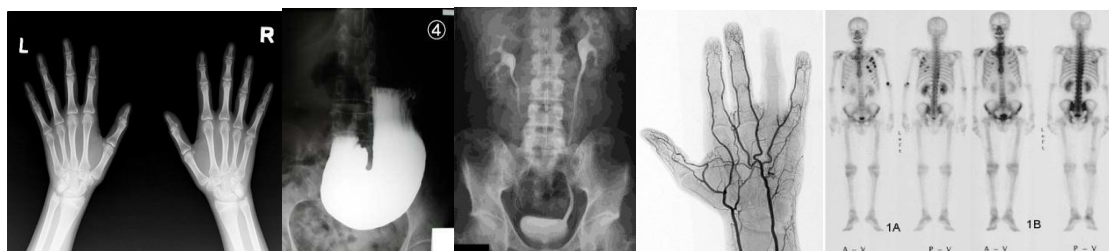
手の X 線画像 ・ バリウム検査 ・ 腎尿管膀胱造影 ・ 手の血管造影 ・ RI 骨シンチ画像

また、放射性同位元素（ラジオアイソトープ：RI）が臨床に利用されるようになったのは 1940 年代後半であり、RI を人体内に投与しその分布を体外から計測しました。RI の体内分布を画像化するシンチレーションカメラは 1956 年に実用化が始まり、 RI 検査 が行われるようになりました。