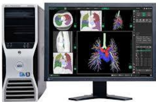
医療向け3D画像解析システム 富士フイルムアナライザー SYNAPS VINCENT (Ver.3.0)

検出器を複数並べることにより、管球が1回転すると、同時に16断面の画像を作成することができます。また、1断面あたりの画像のスライス厚（撮像間隔）は従来の10mm程度と比較すると1mm以下の非常に薄い、したがって詳細な画像を作成できるようになり、短時間の撮影で高精細画像を提供できるというメリットがあります。